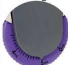
ali-Q 2 e ali-Q 2 VS